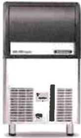
Medium Gourmet 20 g