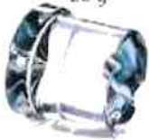
Ø 29 x H 34 mm